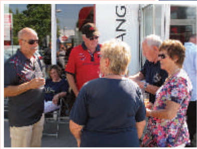
Besser gehts nicht!