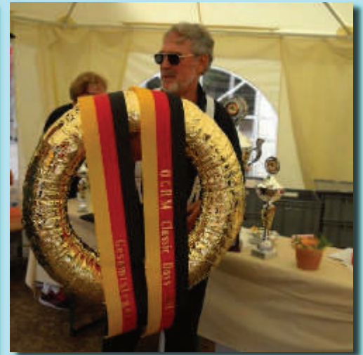
Der Gesamtsieger Team Spindler